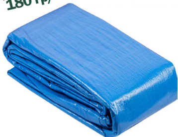
Полот тарпаулиновый 180 гр/м 2

Тарпаулиновый полот 180 гр/м 2 для создания укрьтий и навесов для защиты от солнца. Водонепроницаемые полотна из нитей термопластичного тропоулина (прочный и лёгкий материал, который устойчив к растяжению и совершенно не пропускает влагу).