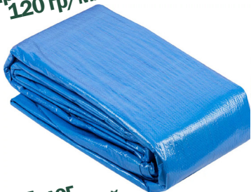
Полот тарпаулиновый 120 гр/м 2

Тарпаулиновый полот 120 гр/м 2 для создания укрьтий и навесов для защиты от солнца. Водонепроницаемые полотна из нитей термопластичного тропоулина (прочный и лёгкий материал, который устойчив к растяжению и совершенно не пропускает влагу).