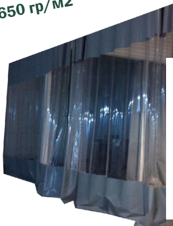
Шторы 650 гр/м 2

Производство ПВХ штор плотностью 650 гр./кв.м. Качественная ТВЧ спайка швов. Вставки из прозрачной ПВХ плёнки толщиной 0,5-0,7мм. Широков применяются на авто-мойках и в производстве. Люверсы по заявке Заказчика.