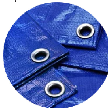
Люверсы металлические круглые/овальные;

Предназначен для укрепления краёв отверстий, использующихся для продевания верёвок, шнуров, тесьмы, тросов и так далее.