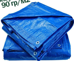
Полот тарпаулиновый 90 гр/м 2

Тарпаулиновый полот 90 гр/м 2 для создания укрьтий и навесов для защиты от солнца. Водонепроницаемые полотна из нитей термопластичного тропоулина (прочный и лёгкий материал, который устойчив к растяжению и совершенно не пропускает влагу).