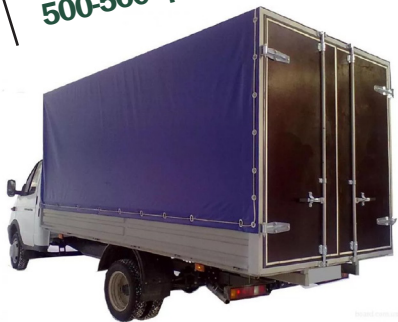
Автотенты 500-560 гр/м 2

Производство автотентов плотностью 500-650 гр./кв.м. Качественная ТВЧ спайка швов. Более 10 видов цвета. Производство крупногабаритных изделий. Люверсы по заявке Заказчика.