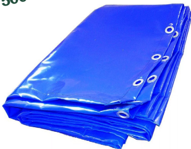
ПВХ тенты 500-560 гр/м 2

Производство ПВХ тентов плотностью 500-650 гр./кв.м. Качественная ТВЧ спайка швов. Более 10 видов цвета. Производство крупногабаритных изделий. Люверсы по заявке Заказчика.